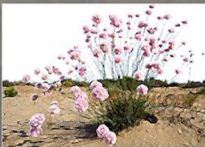
Vegetación y Flora

Esta aplicación hace un recorrido por el trabajo desempeñado a lo largo de los últimos 13 años para describir y caracterizar el territorio Andaluz, conocer su cubierta vegetal y sus hábitats y sintetizar toda esta información como herramienta de apoyo a la gestión.