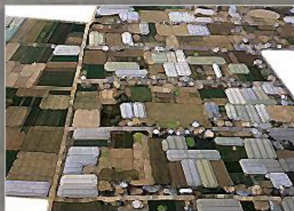
Usos y Coberturas del Suelo