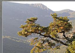
Hábitats de Interés Comunitario