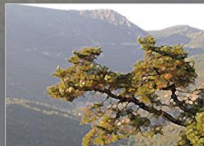
Hábitats de Interés Comunitario