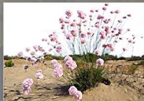
Vegetación y Flora

Esta aplicación hace un recorrido por el trabajo desempeñado a lo largo de los últimos 13 años para describir y caracterizar el territorio Andaluz, conocer su cubierta vegetal y sus hábitats y sintetizar toda esta información como herramienta de apoyo a la gestión.