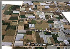
Usos y Coberturas del Suelo